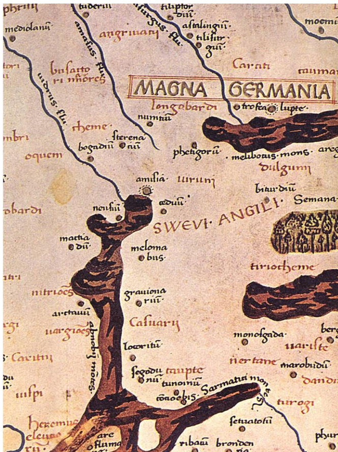
Abb. 1, Karte "Germania Magna" von Ptolemaios (Ausschnitt)

Was hat das mit dem Sälzerweg zu tun? Ein Ort am Sälzerweg und drei Orte im Bereich der Werra und Fulda wurden von den Forschern entschlüsselt: Munitium, Novaesium, Amisia und Melocabus.